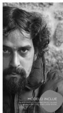
Publicación Modelo INclúe