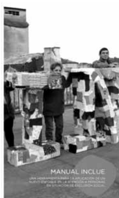
Publicación Manual INclúe

Ademais de todo iso, o feito de que estes resultados se alcancen nun marco de colaboración interinstitucional, cun alto grao de participación e compromiso por parte das entidades socias e colaboradoras, no que as persoas directamente afectadas por situacións de exclusión social participan activamente e en espazos compartidos con responsables e persoal técnico das organizacións, supón, en si mesmo, un dos factores que maior satisfacción xera nesta iniciativa.